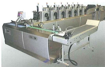
... und Kuvertierung

Besonderer Schwerpunkt des Unternehmens ist, die Abläufe für den Kunden so einfach wie möglich zu machen. Das bedeutet in der Praxis, dass Kunden nur noch Dokumente erstellen, diese per Datenleitung an die letterei.de versenden und dort alle nachfolgenden Abläufe, wie zum Beispiel drucken, falzen, Beilagen zuführen, kuvertieren,